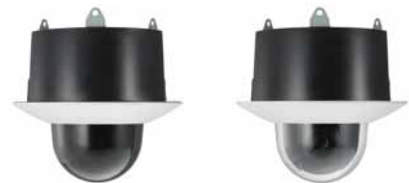
YT-ICB550/T Kit d'encastrement au plafond Dôme teinté