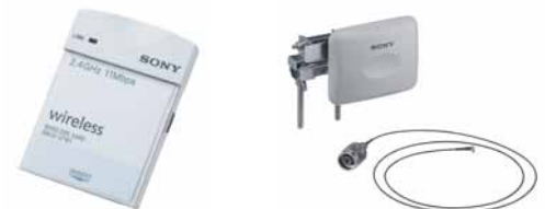
SNCA-CFW1 Carte LAN sans fil