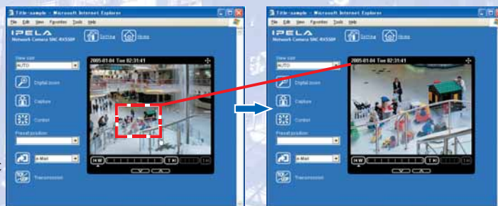
Interface utilisateur intuitive

La série SNC-RX possède une interface utilisateur conviviale accessible via un PC équipé du logiciel de navigation Microsoft® Internet Explorer®. Grâce à ses menus déroulants et à ses icônes, les réglages sont très faciles à réaliser. En pointant et en cliquant directement sur une partie de l'image affichée, la caméra ajuste son niveau de zoom et s'incline pour se centrer sur le point sélectionné. Vous pouvez aussi recentrer et agrandir une zone sélectionnée en maintenant le bouton gauche de la souris appuyé et en faisant glisser celle-ci en diagonale.