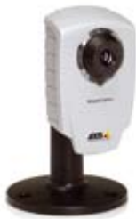
Caméra réseau AXIS 207/207W/207MW avec socle (inclus)