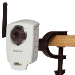
Caméra réseau AXIS 207/207W/207MW avec pince flexible (incluse)